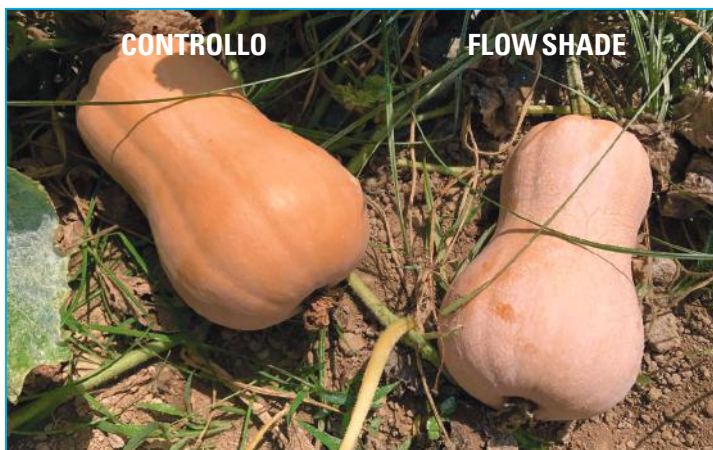
Zucca, confronto tra trattato e non trattato con FLOW SHADE