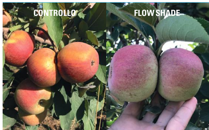
Melo, confronto tra trattato e non trattato con FLOW SHADE